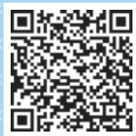
Quellen Fokus 3