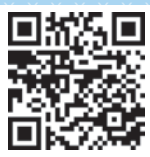
Link zu HLS

Informieren Sie sich im Artikel des Historischen Lexikons der Schweiz (HLS) über die Hexenverfolgungen in der Schweiz in der Frühen Neuzeit.